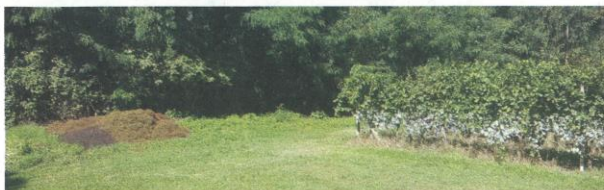
Vigneto con vinaccia depositata a bordo campo e grappoli trattati con caolino.

• mosca delle olive ( Bactrocera oleae , Bo): negli oliveti monitorati con trappole a feromone, specifiche nella cattura degli adulti, si è osservato localmente un forte aumento della presenza della mosca e con esso anche del numero di ovideposizioni sui frutti. Le zone più toccate da questo incremento sono le zone più solatie, specie del Mendrisiotto (in particolare Corteglia e Rancate) e dell'areale sopra Ascona. Si con-