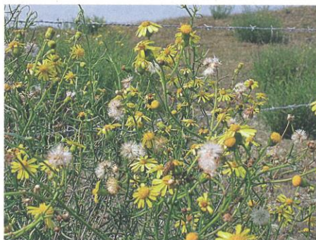
Il senecione ha fiori gialli, si propaga tramite i frutti piumati e le foglie sono larghe 2-3 mm.

Il senecione fiorisce tra la primavera e l'autunno ed è importante intervenire nella lotta affinché non si propaghi in modo massiccio in prati e pascoli. La lotta più efficace risulta l'estirpo delle piante e, siccome i fiori presenti riescono a far maturare i semi anche dopo l'estirpo, la loro eliminazione nei rifiuti solidi urbani in sacchi ben chiusi (utilizzare dei guanti o lavarsi bene le mani alla fine del lavoro). Il senecione sudafricano si diffonde attraverso i semi provvisti di peli bianchi che vengono dispersi dal vento e dagli spostamenti d'aria causati dai mezzi di trasporto. Infatti, in Ticino lo troviamo in modo particolare lungo le vie di comunicazione, ma anche su pareti rocciose e discariche di inerti. Fortunatamente nel nostro Cantone la sua diffusione nei terreni agricoli è ancora contenuta, la sua presenza è limitata ad alcuni pascoli dei Comuni di Manno e Monteceneri.