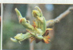
Pero, William's, Solduno, 16.03 Stadio E, mazzetti divaricati