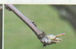
Melo, Golden Delicious, Solduno, 15.03 Stadio C, orecchiette di topo

ni in etichetta, in quanto ci sono alcuni prodotti dove deve essere rispettata una zona tampone non trattata e in alcuni casi questa è pari addirittura a 100 metri dalle acque superficiali!