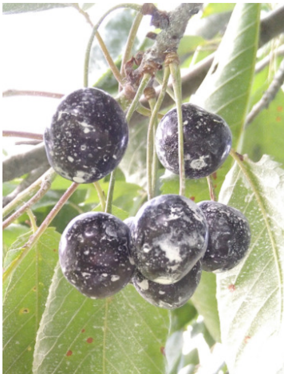
Figura 2: Rivestimento di caolino su ciliegie.