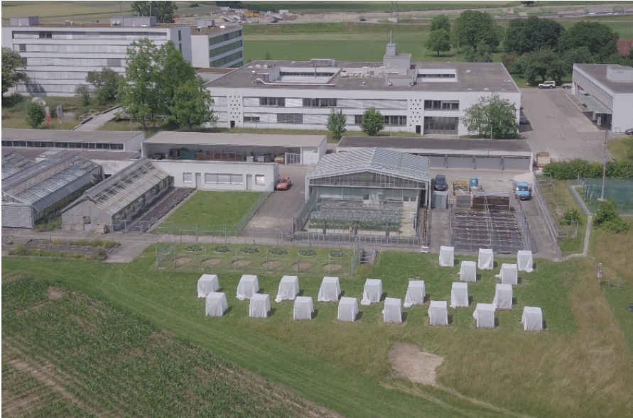
Figura 3: Gabbie usate negli esperimenti di semi-campo. Tre specie di vespe parassitoidi sono state ripetutamente testate sia singolarmente sia in combinazione e paragonate a un testimone senza vespe.